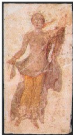
Italie, I er siècle avant J.-C. (Inv. 794.1.317) Fragment de fresque transféré sur panneau de bois.